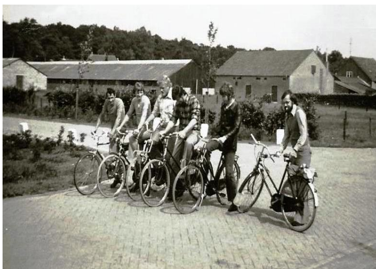
1974 De eerste bewoners van de Meester Hertsigstraat op weg naar de kermis van St. Anthonis.