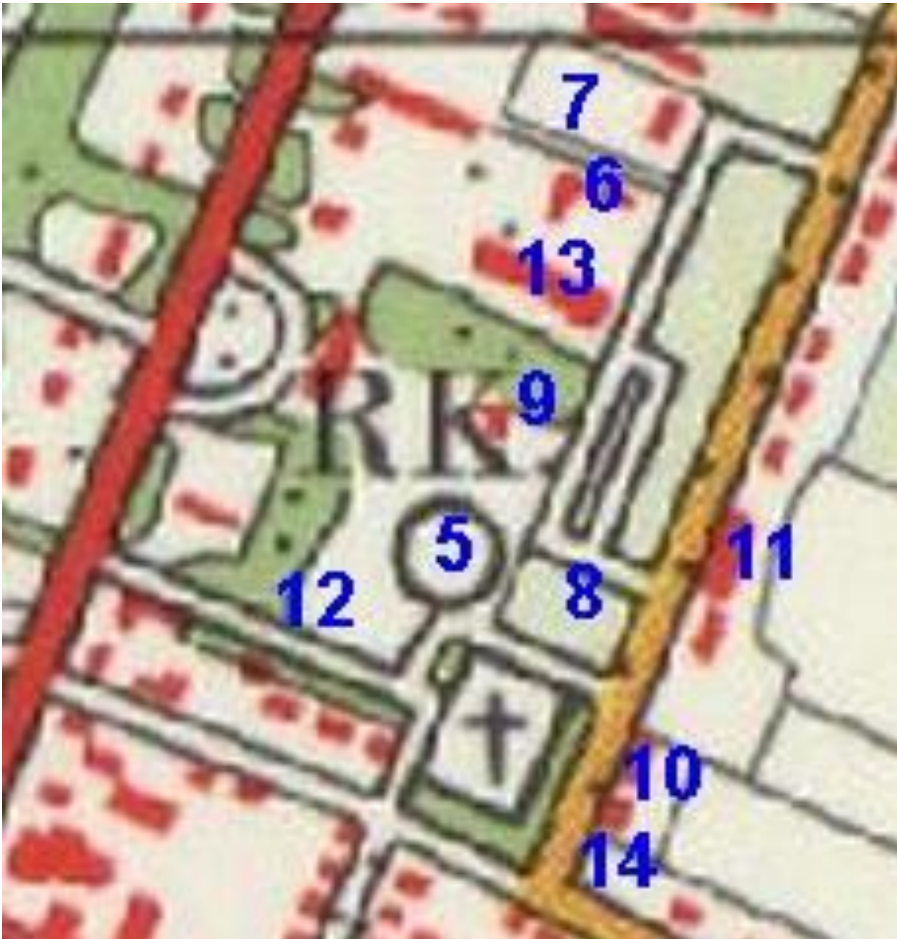
De Rips 1978 (geel gearceerd de Meester Hertsig straat en een klein stukje Lambertweg)