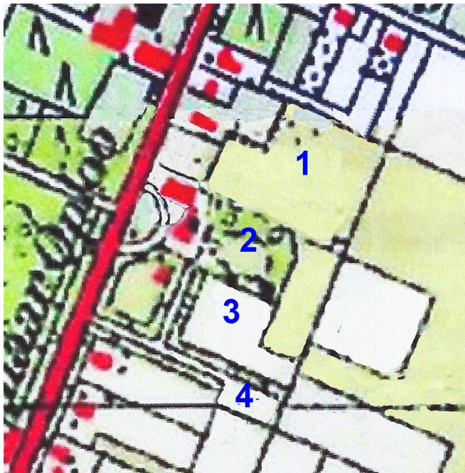
De Rips 1936