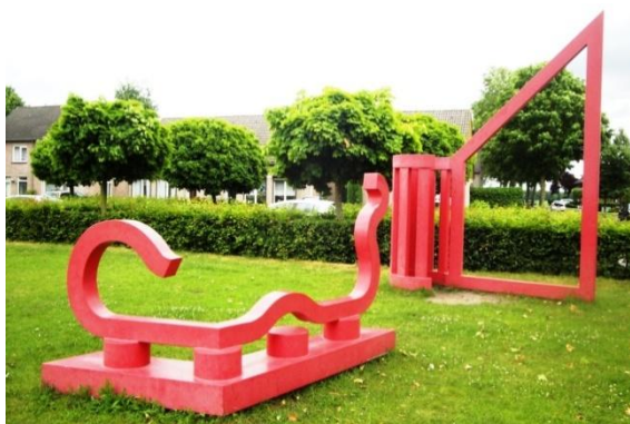
Snakes and Windows kunstobject

De Rips kreeg het kunstwerk "Snakes and Windows" toegewezen door de gemeente. Het kunstwerk is gemaakt door de Veldhovense kunstenaar Wim Geven en is uitgevoerd in twee losse elementen van staal, die in een warm rode kleur zijn gespoten. Het ene deel is vloeiend en in een soort slangenvorm uitgevoerd, het andere is strak en heeft een soort raam vorm. De kleur rood moet als een verbindend element dienen voor de beide onderdelen en voor de omgeving. Het kunstwerk werd geplaatst op 19 juni 1992 op het grasveld bij het dorpsplein. De titel en vorm hebben in De Rips echter nooit veel waardering gekregen. Bij de herinrichting van het dorpsplein werd het kunstwerk dan ook in overleg in oostelijke richting verplaatst en wordt momenteel veelal als "zit- en hangmeubilair" gebruikt door de schooljeugd.