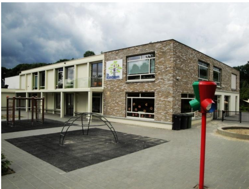
De nieuwe basisschool De Klimboom

Op 22 augustus was de eerste nieuwe schooldag voor de kinderen van basisschool de Klimboom. Het gebouw herbergt niet alleen de basisschool maar ook de kinderopvang en de peuterspeelzaal.