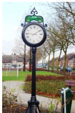
Klok op het plein geschonken door de ZLTO 2007