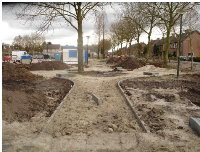
Herstructurering wegdek en riolering Meester Hertsigstraat en het Dorpsplein in 2007 en 2001