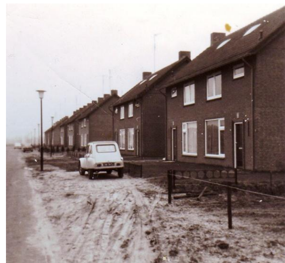
De Meester Hertsigstraat in 1972